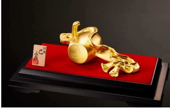
純金置物「巳」<津田永寿 原型作>