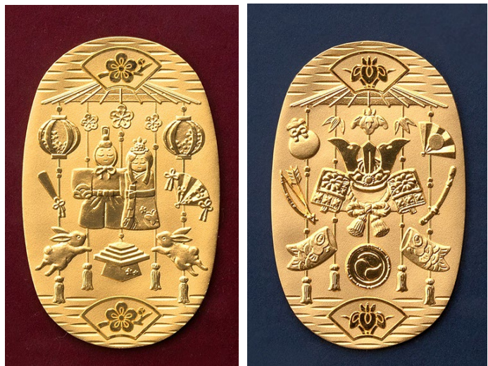
純金 節句小判額(お雛様)、純金 節句小判額(兜) 純金小判部分 拡大

小判は額装しているため、場所を取らず、インテリアとして季節に合わせて飾って楽しんでいただけるほか、コンパクトに収納することも可能です。