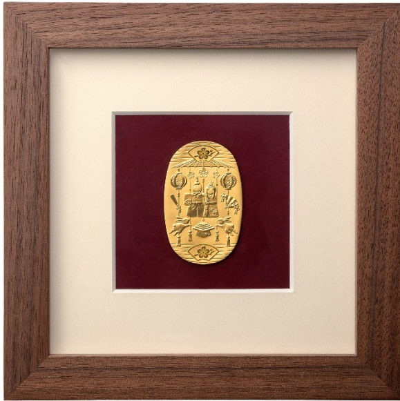
純金小判額「桃の節句」