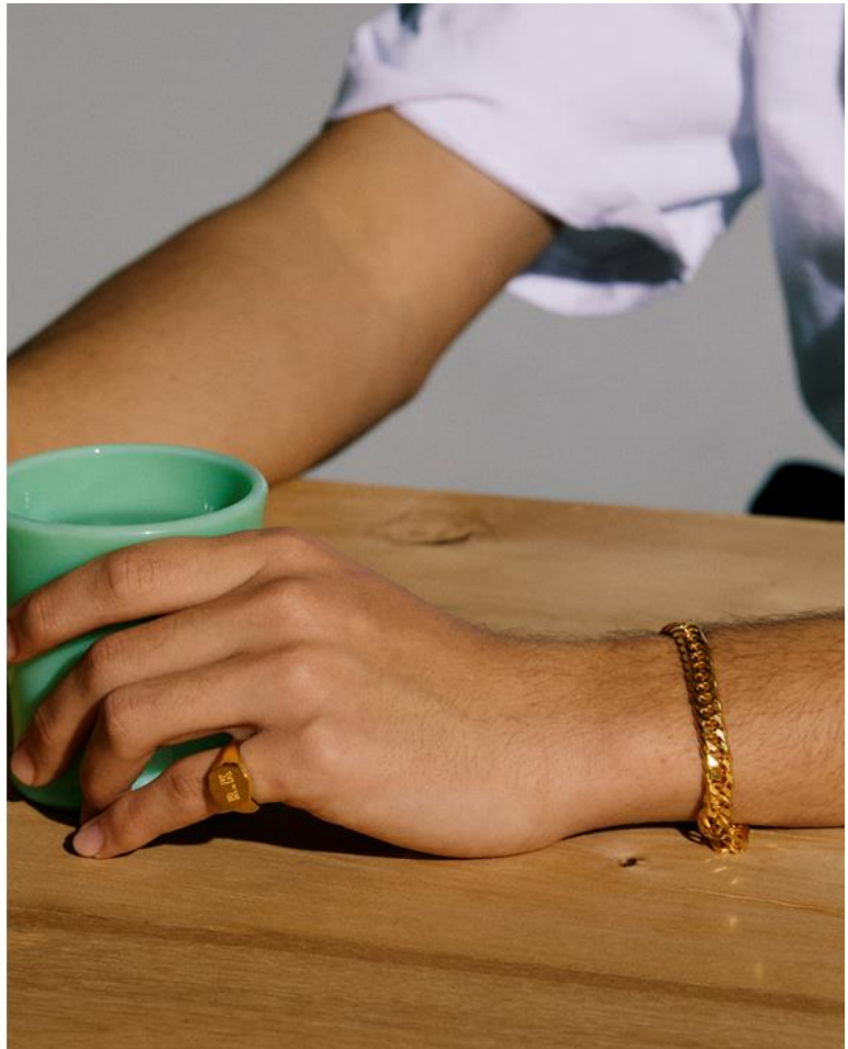
K24 シグネットリング 八角型 K24 キヘイブレスレット (6面カットダブル) 40g/20cm