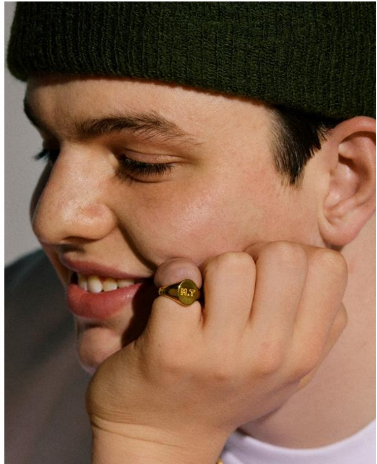
K24 シグネットリング オーバル型 K24 キヘイネックレス (6面カットダブル) 50g/50cm