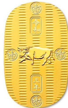
純金大判「丑 令和三年」200g

また、松竹梅をモチーフにした美しい細工の施された18金製の耳かきは、ユニークで小粋なギフトとして人気を博しています。純金ならではの美しさに加え、なめらかな肌触りと使い心地の良さが日常にとっておきのリラックスタイムを与えてくれます。