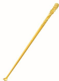
18金製 耳かき (松竹梅)

ギンザタナカでは、シーズン商品から日用品まで、シーンや嗜好に合わせた様々な貴金属商品を取り揃えており、バラエティ豊かなラインナップから特別なギフトをお選びいただくことができます。