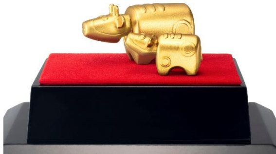
純金置物「赤べこ」<遠藤良亮原型作>

2021年の干支「丑」は粘り強さや誠実さを表すモチーフと言われています。コンパクトで置き場所を選ばない純金置物は縁起物としてインテリアに華やぎを与えてくれ、「令和三年」の年号と躍動感あふれる丑の姿がデザインされた純金大判は、新年ならではのギフトや記念品にも最適です。