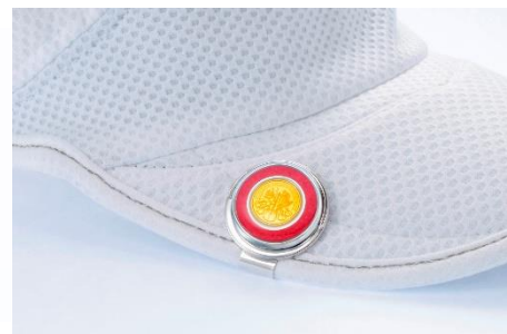
ウィーン金貨ハーモニー1/25オンス グリーンマーカ