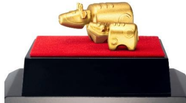
純金置物「赤べこ」＜遠藤良亮原型作＞