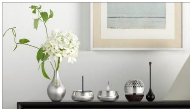
プラチナ・モダン仏具「伝 -DEN-」