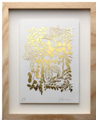
「金箔アート ボタニカル No.1」