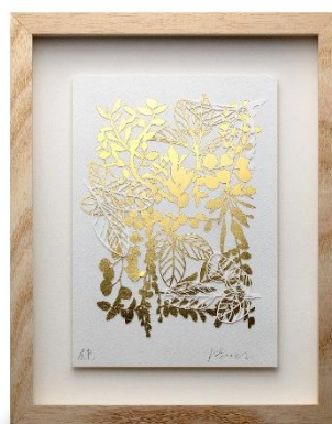
「金箔アート ボタニカル No.1」