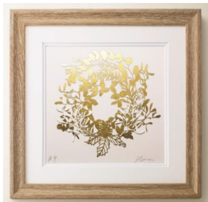
「金箔アート クリスマスリース」