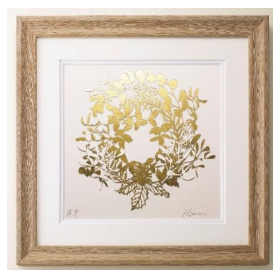
「金箔アート クリスマスリース」