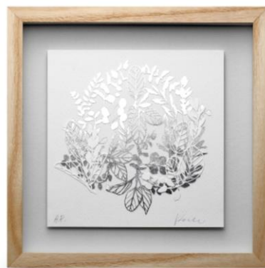
「プラチナ箔アート ボタニカル No.2」