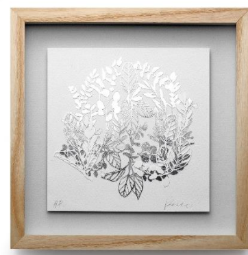
「プラチナ箔アート ボタニカル No.2」