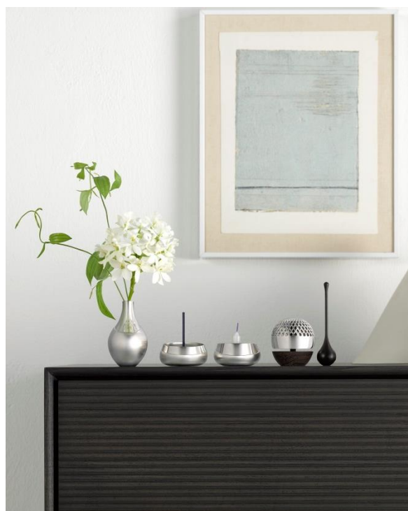
(写真右から 仏鈴、火立、香立、花立)