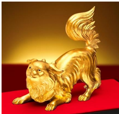
「純金製置物 戌」(高村光雲 原型作)