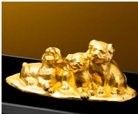
「純金製置物 犬」(津田永寿 原型作)