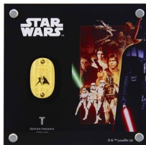
「スター・ウォーズ 純金製 10g 小判 ルーク・スカイウォーカーVS ダース・ベイダー」