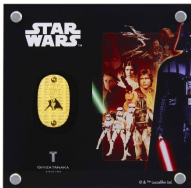
「スター・ウォーズ 純金製 10g 小判 ルーク・スカイウォーカーVS ダース・ベイダー」