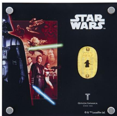
「スター・ウォーズ 純金製 10g 小判 ヨーダ」