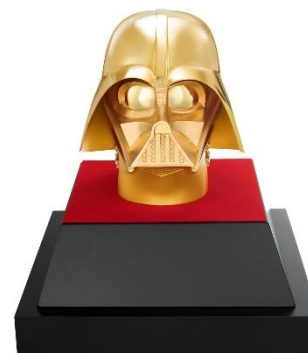
「スター・ウォーズ 純金製 ダース・ベイダー ライフサイズマスク」