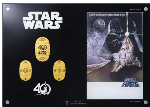
「スター・ウォーズ 40周年記念 純金製小判額」(表面)