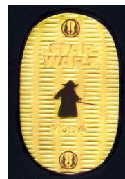
「スター・ウォーズ 純金製 10g 小判 ヨーダ」(小判部分)

「スター・ウォーズ 純金製 10g 小判 ヨーダ」(下図・右)は、『エピソード 1~3』に登場するキャラクター達がデザインされたアクリルケースにセットしました。小判には、「スター・ウォーズ」のキャラクターの中でも根強い人気の「ヨーダ」のシルエットをデザイン。上下にはジェダイのマークをあしらっています。