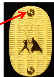
「スター・ウォーズ 純金製 10g 小判 ルーク・スカイウォーカー VS ダース・ベイダー」(小判部分)

「スター・ウォーズ 純金製 10g 小判 ヨーダ」(下図・右)は、『エピソード 1~3』に登場するキャラクター達がデザインされたアクリルケースにセットしました。小判には、「スター・ウォーズ」のキャラクターの中でも根強い人気の「ヨーダ」のシルエットをデザイン。上下にはジェダイのマークをあしらっています。