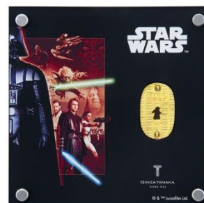
「スター・ウォーズ 純金製 10g 小判 ヨーダ」

※金相場により価格が毎日変動します。参考価格は、金税込小売価格 4,900 円/g で計算しております。