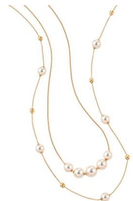
カジュアルなデザインのパールジュエリーは気軽に身につけられ、装いに上質感を添えます。

その他、お食事会やちょっとしたお出掛けにも使えるパールジュエリーとして、ステーションネックレスやスライド式でパールの位置が自由に変えられるデザインのネックレスもお勧めです。パールならではの清楚な印象がありつつも、フォーマルからカジュアルな装いまで、様々な楽しむことができます。