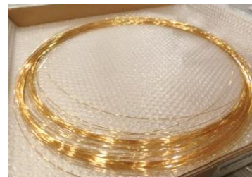
ツリーに使用している純金線