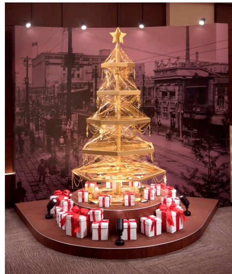
GINZA TANAKA ゴールドクリスマスツリー

バックパネルには、2016年にGINZA TANAKA が本店を日本橋から銀座に移転して90周年を迎えたことを記念し、90年前の銀座の街並を描いています。GINZA TANAKA が銀座の地で培ってきた90年間の様々な歴史や伝統と、これからも変わることなく銀座の土地で輝き続けていたいという想いを、繊細なラインアートで作られた純金製のクリスマスツリーの美しい輝きで表現した逸品です。