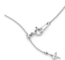
オリジナルのエンドパーツ

500,000 円/Pt900・Pt850、H&C ダイヤモンド計約 0.85ct/最長 45cm