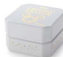
専用ジュエリーケース

※商品価格(税込)などは予告なく変更する場合がありますので、予めご了承ください。