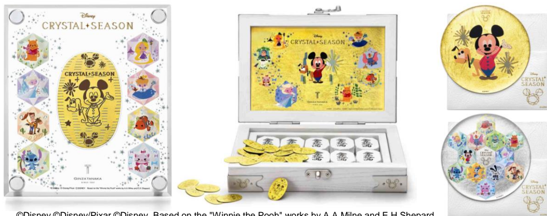
©Disney ©Disney/Pixar ©Disney. Based on the "Winnie the Pooh" works by A.A.Milne and E.H.Shepard.

1892年に創業した貴金属の老舗 GINZA TANAKA(田中貴金属ジュエリー株式会社 本社:中央区銀座、代表取締役社長執行役員:田中 まさかず 和和、以下 GINZA TANAKA)は、ディズニー「クリスタルシーズン」をモチーフに製作した新作7アイテム(純金製小判3種、純金千両箱2種、手鏡2種)を、2016年6月17日(金)から2017年2月28日(火)まで期間限定で、GINZA TANAKA 10店舗とGINZA TANAKA オンラインショップにて発売します。