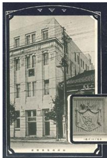
1920年に落成した山崎ビルヂング