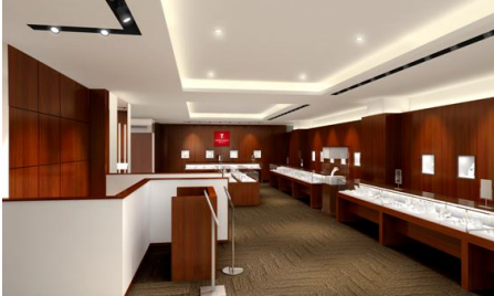
GINZA TANAKA 銀座本店 内観イメージ