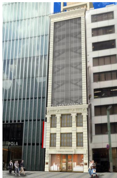
GINZA TANAKA 銀座本店 外観イメージ