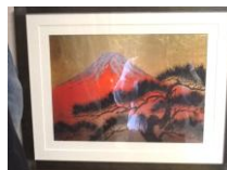
商品名：切り絵金箔額「赤富士」 価格：400,000円