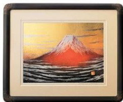
商品名：切り絵金箔額「赤富士」 税込価格：100,000円