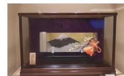
商品名：純銀置物絵巻物「富士」 価格：119,000円