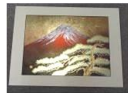
商品名：切り絵金箔額「赤富士」 税込価格：500,000円