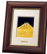
商品名：純金製祝い額「富士」 税込価格：165,000円