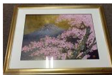
商品名：金箔切り絵額「桜富士」 税込価格：400,000円