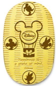
「ディズニー 純金製小判 2013 年度版」

30g 用千両箱(外寸)サイズ:幅約 25.5cm×奥行約 16.5cm×高さ約 5.5cm