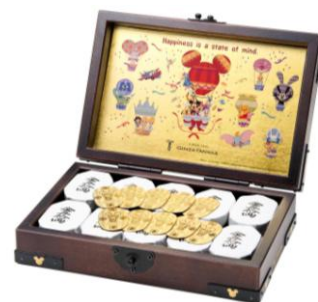
「ディズニー 純金製小判 2013 年度版 千両箱」