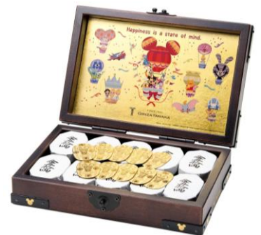
「ディズニー 純金製小判 2013 年度版 千両箱」