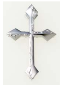
<ペンダントトップ(クロス)裏面>