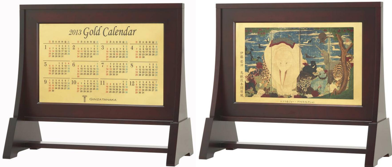
純金 6kg ビッグカレンダー2013 伊藤若冲「鳥獣花木図屏風」

創業 120 周年を迎えた貴金属ジュエリーの老舗 GINZA TANAKA(田中貴金属ジュエリー株式会社本社:中央区銀座、代表取締役社長:田中 まさかず 和和、以下 GINZA TANAKA)は、この度、2013 年に東北 3 県で開催される展覧会『東日本大震災復興支援 特別展「若冲が来てくれましたープライスコレクション 江戸絵画の美と生命」』とコラボレーションし、人気の伊藤若冲の代表作「鳥獣花木図屏風」を純金 6kg にあしらった「純金 6kg ビッグカレンダー2013 伊藤若冲『鳥獣花木図屏風』」(税込価格 6,000 万円)を販売します。また、同様のデザインの純金カレンダー(5g・1g)と金箔葉書その他、若冲や鈴木其 かずき 一の絵画をあしらった金箔葉書・しおりなど全 8 アイテムを、2012 年 11 月 14 日(水)から GINZA TANAKA 全国 8 店舗とオンラインショップ、そして展覧会会場(一部商品を除く)で販売します。