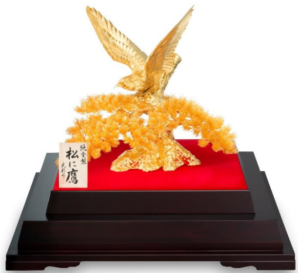
匠の技が光る貴金属工芸品を多数取り揃えています