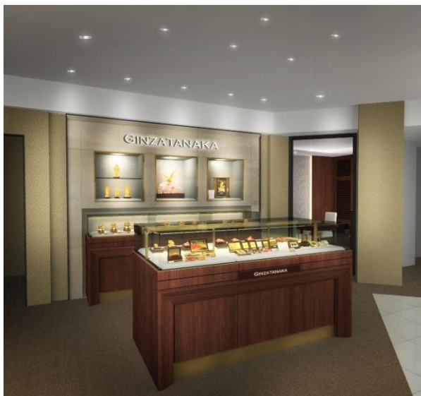
店頭イメージ(部分)

GINZA TANAKA は創業以来、一貫してクオリティーの高い貴金属商品を提供しています。中京地区では、路面店の「GINZA TANAKA 名古屋店」、「GINZA TANAKA BLIDAL 栄店」(ブライダル専門店)に続く3店舗目の出店となります。「名古屋三越 栄店」は名古屋の中心地で交通のアクセスの良い栄地区にあるため、幅広い層の集客が見込まれることに加え、三越ならではの新規顧客への訴求力が期待されることから新店舗出店の運びとなりました。「GINZA TANAKA 名古屋三越 栄店」オープンにより、中京地域でのGINZA TANAKAの認知度・信頼度の拡大を図り、より地域に根ざした展開を図ってまいります。